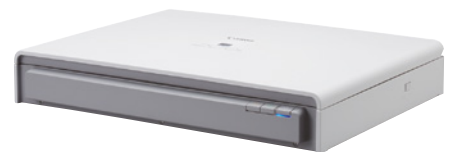
Glace d'exposition A 3 Flatbed 201