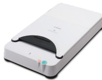
Glace d'exposition A4 Flatbed 101

Numérisez des livres reliés, des journaux et des supports délicats en ajoutant la glace d'exposition Flatbed 101 pour les documents jusqu'au format A4 ou la glace d'exposition Flatbed 201 pour la numérisation en A3. Dotées d'une connexion USB, ces glaces d'exposition s'intègrent parfaitement avec le DR-6030C. Les glaces d'exposition Flatbed 101 et Flatbed 201 bénéficient d'un contrôle de la lumière ambiante exceptionnel permettant la numérisation avec le cache d'exposition ouvert pour plus de rapidité, alors que le capteur 1200 dpi assure une qualité d'image exceptionnelle.