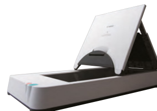
A4 Flatbed Scanner Unit 101