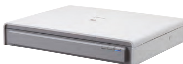
A3 Flatbed Scanner Unit 201

Numérisez des livres reliés, des journaux et des supports délicats en ajoutant la glace d'exposition Flatbed 101 pour les documents jusqu'au format A4 ou la glace d'exposition Flatbed 201 pour la numérisation en A3. Dotées d'une connexion USB, ces glaces d'exposition s'intègrent parfaitement avec le DR-M140. Les glaces d'exposition Flatbed 101 et Flatbed 201 bénéficient d'un contrôle de la lumière ambiante exceptionnel permettant la numérisation avec le cache d'exposition ouvert pour plus de rapidité, alors que le capteur 1 200 dpi assure une qualité d'image exceptionnelle.