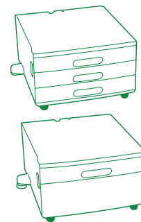
Support pour tiroir 520 feuilles