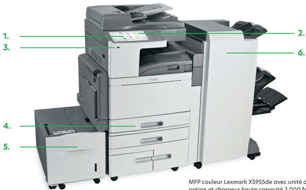
MFP couleur Lexmark XS955de avec unité de finition de livret en option et chargeur haute capacité 2 000 feuilles.