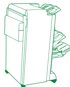
Module de finition de livret